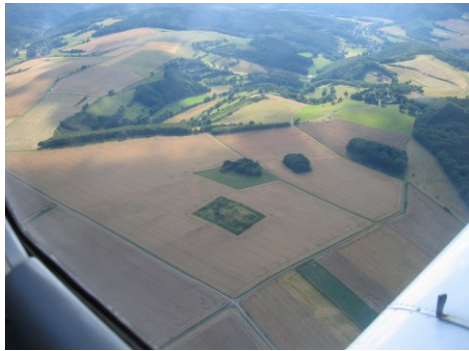
Vanuit de lucht gezien