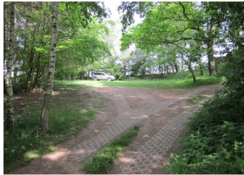
Ingang en parkeerplaats